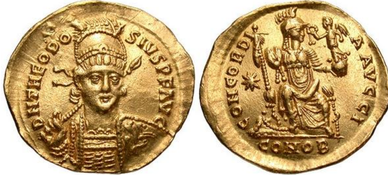
(1. kép – illusztráció!)

Az éremlelet talán egy 440-es évek elején lezajlott balkáni hun hadjáratban szerzett zsákmány része lehetett, vagy a Bizánc által fizetett évi „békepéNZ” töredéke (amit az is bizonyít, hogy a pénzek között csak viszonylag kevés típus fordul elő, valamint a használat okozta kopásnyomok egyik példányon sem jelentkeznek). Elrejtésének ideje 445 és 453 közé tehető, teaurálásának okairól, egykori tulajdonosáról csak találgatni tudunk.